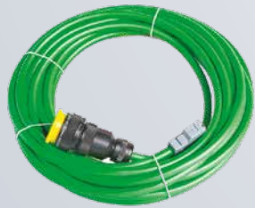
Strom- und Motorkabeln