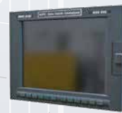
Mori Seiki Mapps