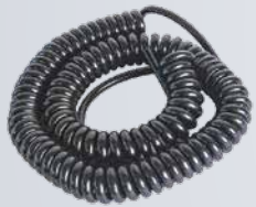
Strom- und Motorkabeln

Antriebe / Sensoren / CNCs / Elektromagnetische Ventile Monitore / Stromversorgungen / Kodierer / Sicherungen Kühler / Ventilatoren / Mapps / Batterien / Hydraulikaggregate