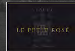
Le petit Rosé - Extra trocken IGT - Sekt Traubensorte: Syrah Martinotti-Charmat Methode