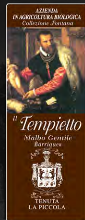
Il Tempietto IGT - Rotwein Traubensorte: Malbo Gentile Reifung: 36 Monate im Barrique Flaschenveredelung: 6 Monate