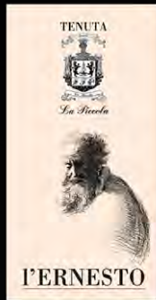
L'Ernesto - Rotwein Traubensorte: Cabernet Flaschenveredelung: 6 Monate