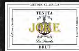
Joke Brut Limited Edition - Sekt Traubensorte: Petit et Gros Manseng incrocio Manzoni Traditionelles Flaschengärverfahren